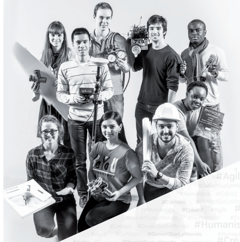
Mise en pages: Céline Emonet - Impression: CAP